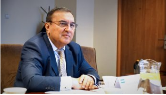
Spotkanie z Ambasadorem Uzbekistanu w Polsce