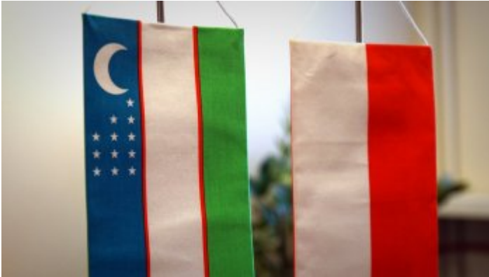
Spotkanie z Ambasadorem Uzbekistanu w Polsce