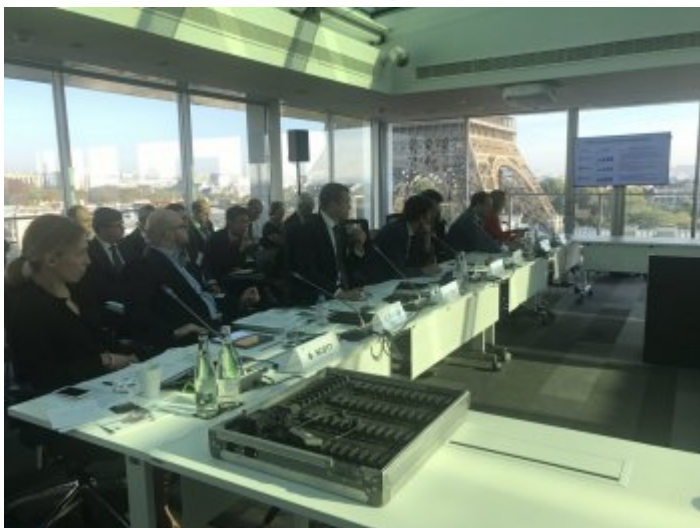
Minister Witold Bańka wziął udział w posiedzeniu Komitetu Wykonawczego WADA, które odbyło się w niedzielę w Paryżu. Reprezentował tam państwa członkowskie Rady Europy.