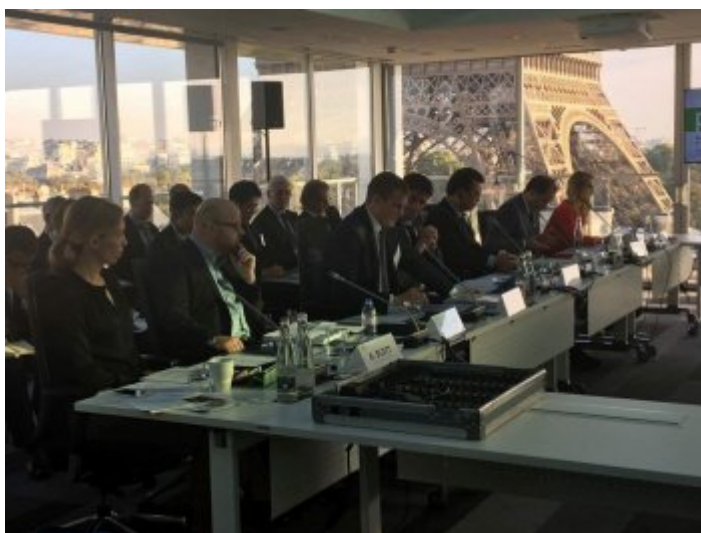
Minister Witold Bańka wziął udział w posiedzeniu Komitetu Wykonawczego WADA, które odbyło się w niedzielę w Paryżu. Reprezentował tam państwa członkowskie Rady Europy.

Komitet Wykonawczy to obok Zarządu najważniejszy organ WADA. Tworzy go 12 osób, z których połowa reprezentuje władze publiczne (po jednym z każdego z kontynentów), a połowa ruch sportowy. Komitet spotyka się trzy razy w roku i odpowiada za niektóre kluczowe dla walki z dopingiem decyzje, w tym zatwierdza Listę substancji i metod zabronionych oraz szereg dokumentów technicznych. Minister Bańka został członkiem Komitetu Wykonawczego 18 maja br.