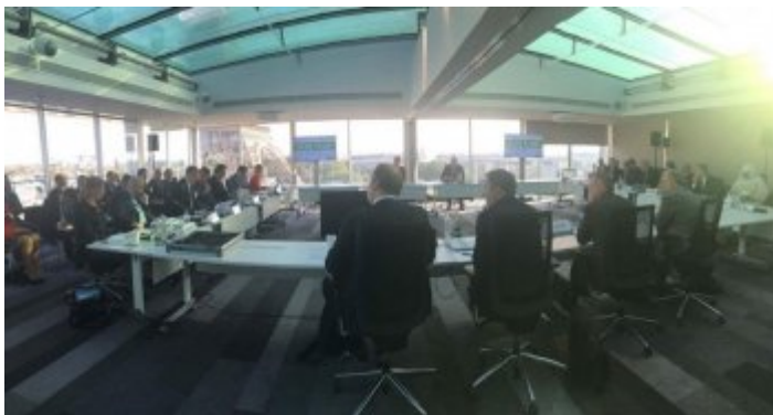
Minister Witold Bańka wziął udział w posiedzeniu Komitetu Wykonawczego WADA, które odbyło się w niedzielę w Paryżu. Reprezentował tam państwa członkowskie Rady Europy.