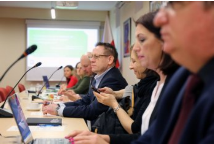
Drugie posiedzenie Zespołu ds. opracowania regulacji prawnych dotyczących szlaków turystycznych w Polsce