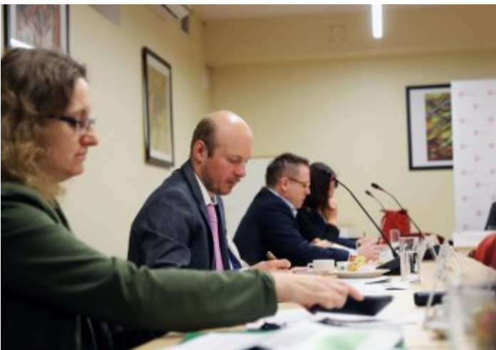
Drugie posiedzenie Zespołu ds. opracowania regulacji prawnych dotyczących szlaków turystycznych w Polsce