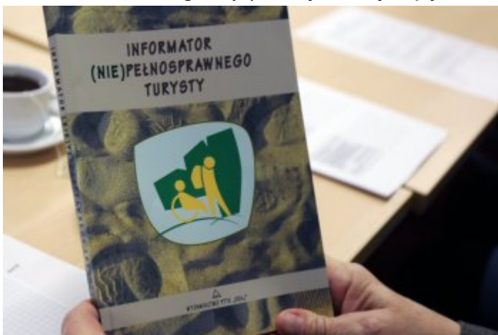
Drugie posiedzenie Zespołu ds. opracowania regulacji prawnych dotyczących szlaków turystycznych w Polsce