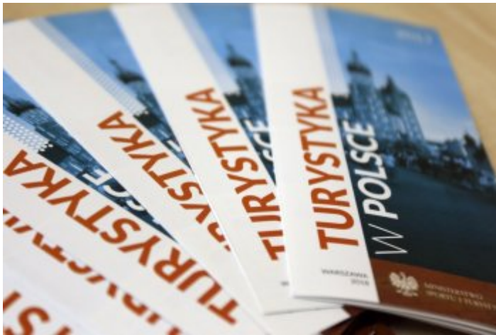
Drugie posiedzenie Zespołu ds. opracowania regulacji prawnych dotyczących szlaków turystycznych w Polsce