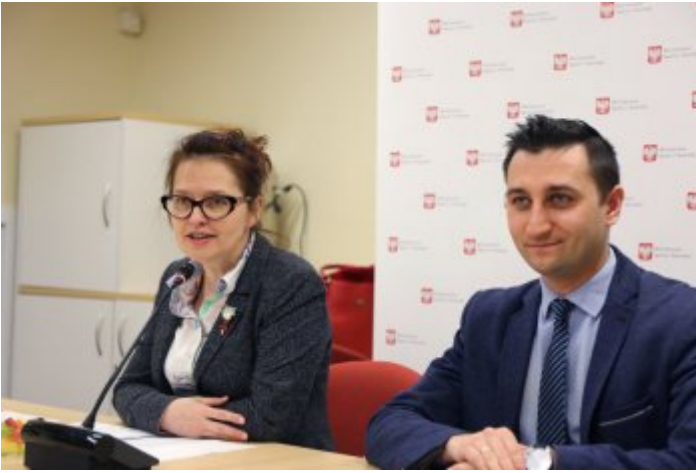
Drugie posiedzenie Zespołu ds. opracowania regulacji prawnych dotyczących szlaków turystycznych w Polsce