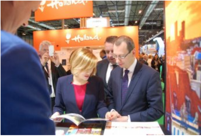
Międzynarodowe Targi Turystyczne FITUR w Madrycie