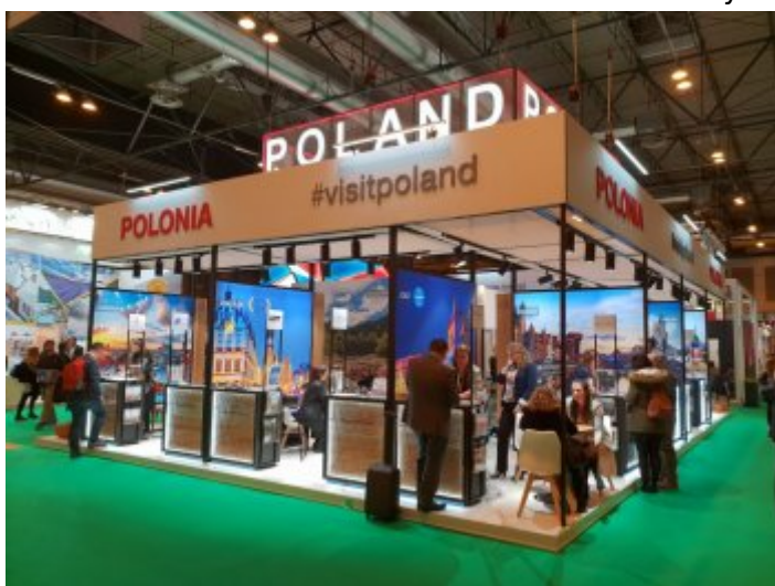
Międzynarodowe Targi Turystyczne FITUR w Madrycie