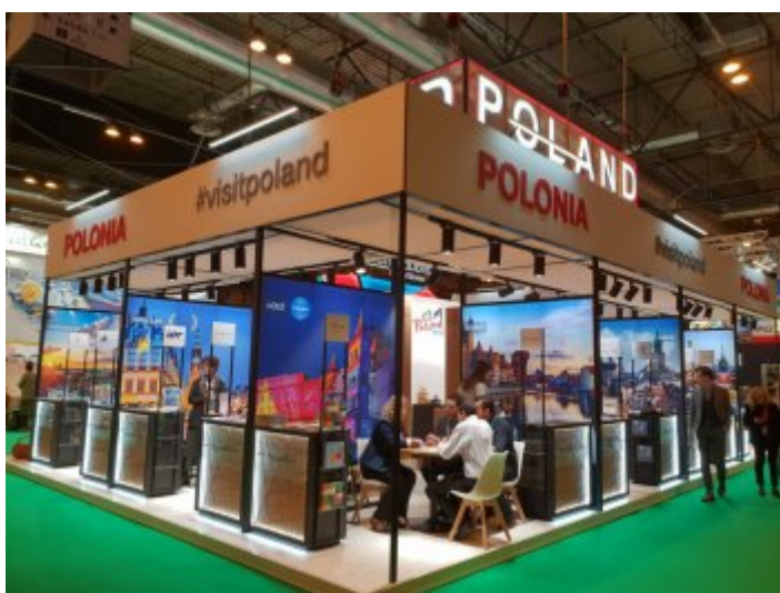
Międzynarodowe Targi Turystyczne FITUR w Madrycie