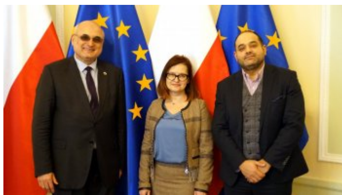
Ambasador Republiki Bułgarii z wizytą w MSiT