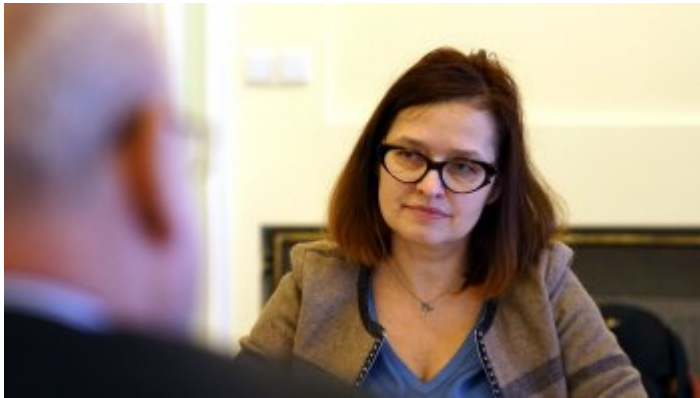
Ambasador Republiki Bułgarii z wizytą w