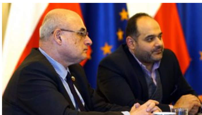
Ambasador Republiki Bułgarii z wizytą w MSiT