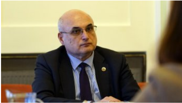
Ambasador Republiki Bułgarii z wizytą w